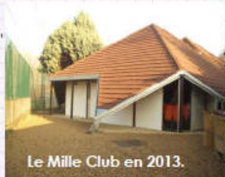
Le Mille Club en 2013.

Le remplacement de la toiture à la suite d'une enquête du Sénat sur l'entretien de ces édifices apportait une nouvelle couleur à l'édifice.